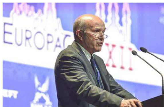
Профессор Йоганнес Лерхер, президент EFCATS, представил пленарную лекцию памяти выдающегося химика Франсуа Голта.