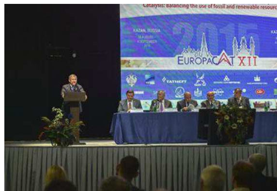
Президент Республики Татарстан Рустам Нургалиевич Минниханов открывает конгресс и приветствует его участников.

В последующие 5 дней работа Конгресса проводилась в ГТРК “Корстон-Казань” одновременно на 4 сессиях, что позволило участникам выбрать из множества презентаций и